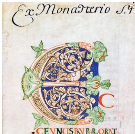
Инициал «С» в Книге псалмов. XI в. Аббатство Мон-Сен-Мишель