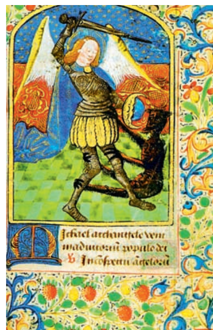
Святой Михаил сражается с дьяволом. Часослов города Аврани. 1480 г.