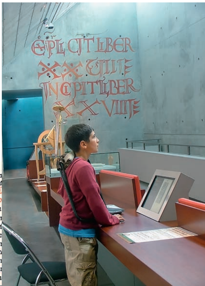
Главные посетители музея Scriptorial – дети