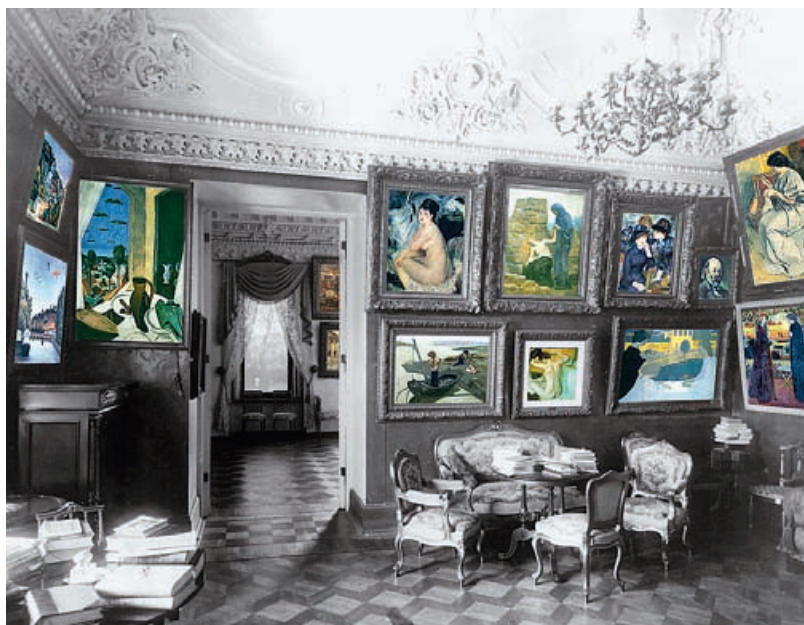
Картины Дерена, Ренуара, Мориса Дени – история «шукинских увлечений»