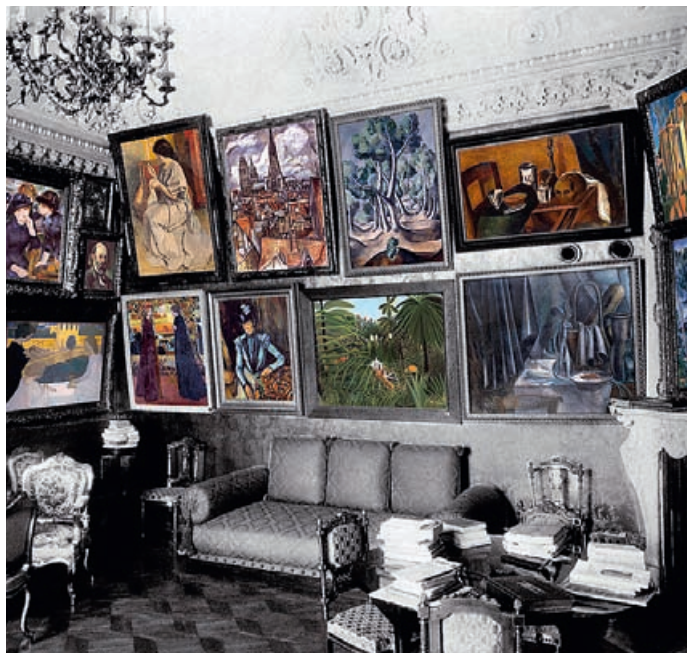
Разве можно соревноваться с такой коллекцией? 37 полотен Матисса и 51 – Пикассо, не говоря об импрессионистах, фовистах и прочих французских классиках начала XX века

Письма он пишет на компьютере, а раздавать автографы приходится редко. Мало кто узнает в высоком бородаче в круглых очках внука-скандалиста последнего щедрого дарителя из знаменитой фамилии купцов Шукиных.