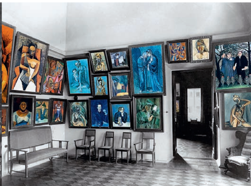
В 25-метровом кабинете помещалось более пятидесяти картин Пикассо