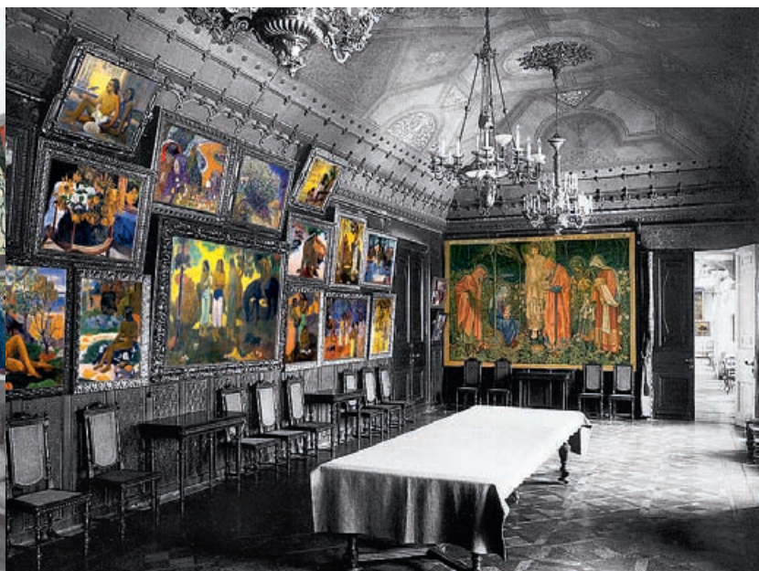
Столовая со знаменитым «иконостасом Гогена»