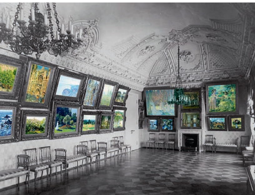
Музыкальный салон. На стене – полотна Клода Моне