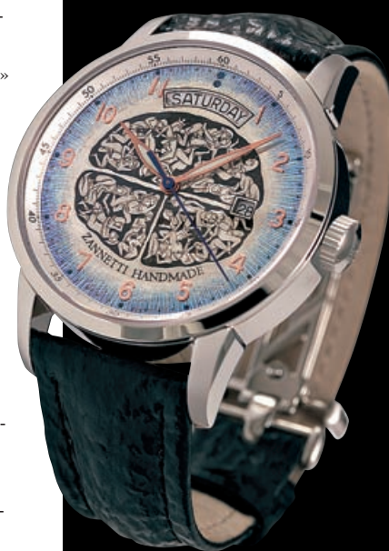
Механические часы Brain Orgy в стальном корпусе с автоматическим заводом.