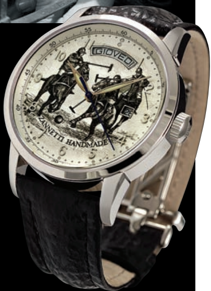
Механические часы Regent Polo с автоматическим заводом

Римская тема в часах Zannetti заявлена прямо в названиях коллекций. В Impero мощные круглые корпуса, словно щиты легионеров, обведены орнаментом тончайшей гравировки. Выделенные цифры циферблата — естественно, римские — велики настолько, что, кажется, будто отмечают не часы, а века. Сочетание белого, красного и золотого цветов в комбинации с торжественным черным напоминает о белых тогах, алых плащах и золотых шлемах императорских всадников. И даже крупные шестигранные заводные головки выглядят основательно и воинственно.