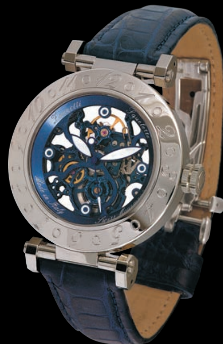
Модель Squelette — небольшой, но выразительный шедевр тонкой механики