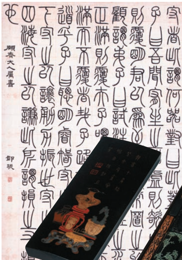
Футляр для кистей. Лак. Эпоха Kangxi

Да, и пожалуй, самое трогательное на этом виртуальном столе — домик для сверчка. Ведь китайцы хотя и говорят слишком громко, но к звукам относятся трепетно и обожают слушать. Они могут различить, как стучит дождь по листьям банана и как по стеблям бамбука. Даже сверчков и тех они различают: боевые «чуй чу» совсем не то, что певчие «го го», чье нежное стрекотание помогает сосредоточиться. А кому-то и вовсе заменяет друга, как маленькому «последнему императору» Пу И.