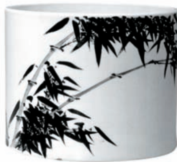
Подставка для кистей с изображением бамбука. Фарфор. Конец XVII века

Во время своей работы мастер не должен отвлекаться — он погружен в творчество.