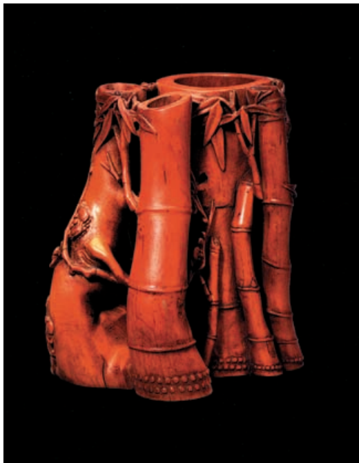
Подставка для кистей в форме бамбуковых стеблей. Дерево. Династия Qing