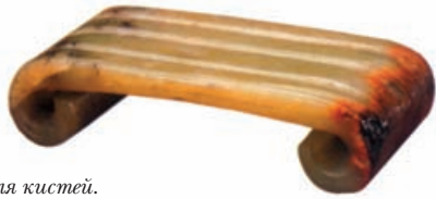
Подставка для кистей. Желтый нефрит. Династия Qing