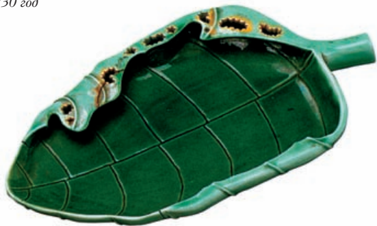
Тушечница в форме листа. Фарфор. Эпоха Kangxi