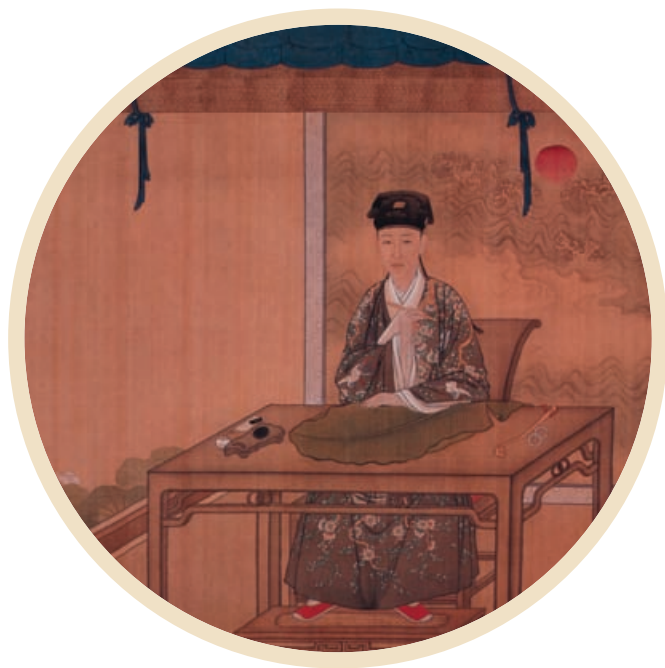
Принц Hongli занимается каллиграфией на банановом листе. 1730 год