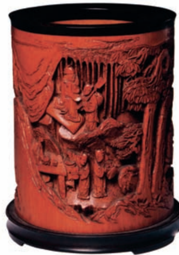
Подставка для кистей. Бамбук. Династия Qing

Как пользоваться тушью? Тушь растирают и разводят в небольшом количестве воды на специальной площадке — тушечнице.