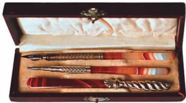
Любимый набор для письма Мариэтты Шагинян — перо, карандаш-вставочка и нож для открывания конвертов (серебрик, сталь)