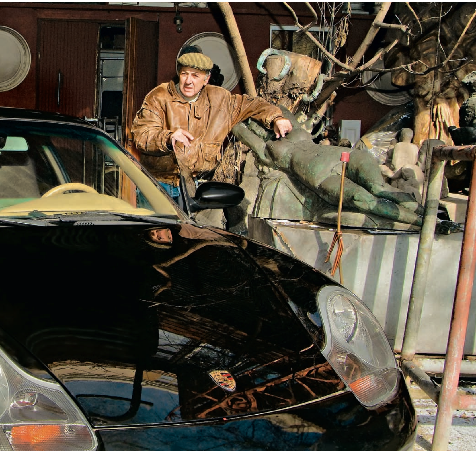
Porsche — машина активных, творческих людей