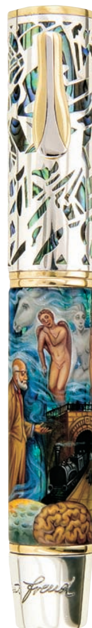
Коллекция ручек Кроне Sigmund Freud выпущена лимитирован- ным тиражом: 388 первых ручек и 38 роллеров

— Но я же уже говорил: это для людей с юмором, совершенно нормально.